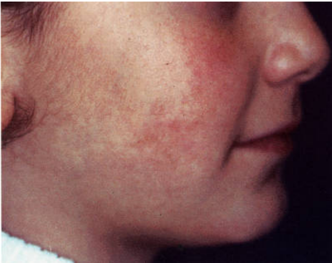
Abb. 1 und 2: 5-jähriges Mädchen mit Cafe-au-lait-Fleck im Gesicht vor und nach 3 Behandlungen