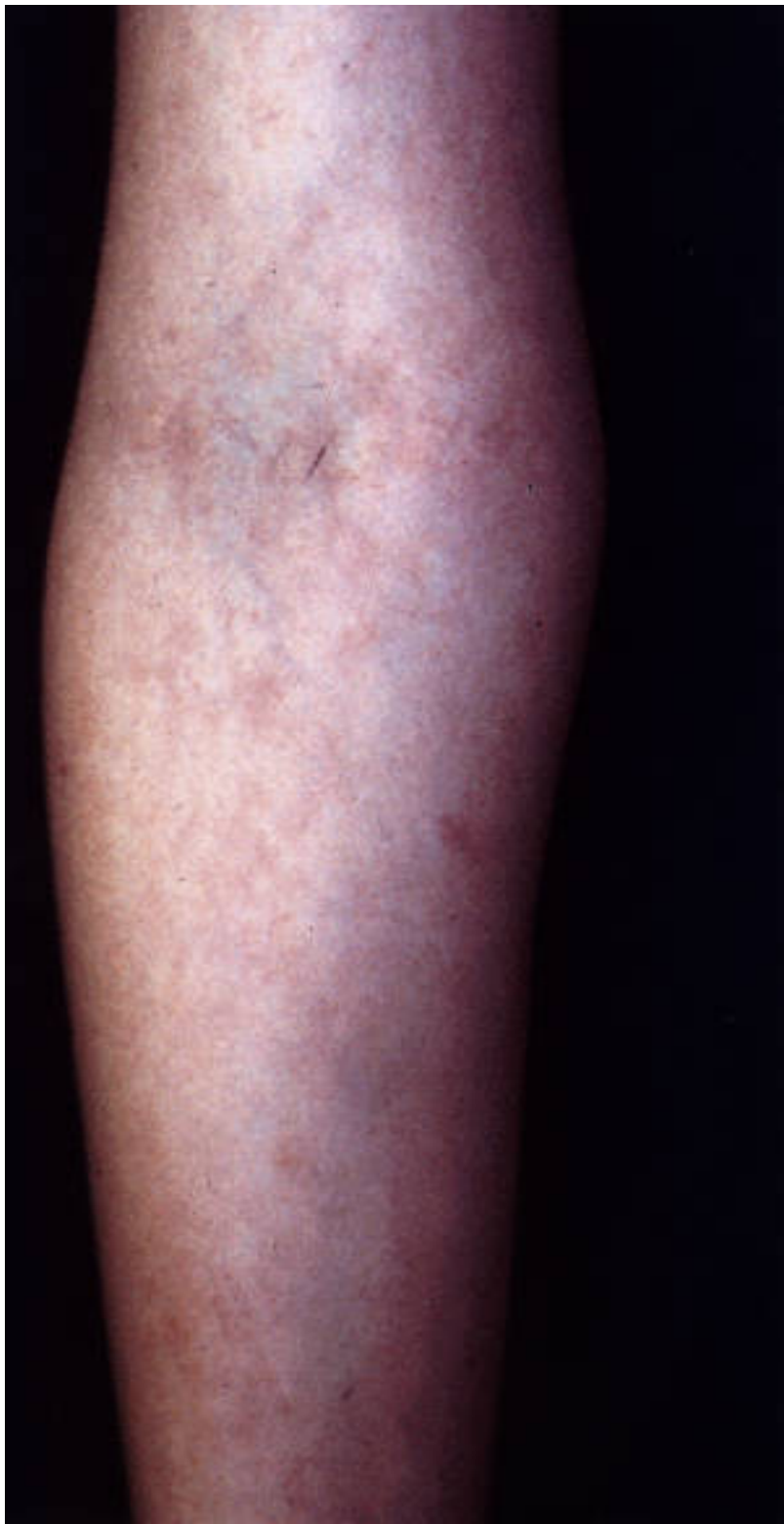
Abb. 11 und 12: 8-jähriges Mädchen mit Mollusca contagiosa am Arm vor und nach einmaliger Behandlung mit dem gepulsten Farbstofflaser.