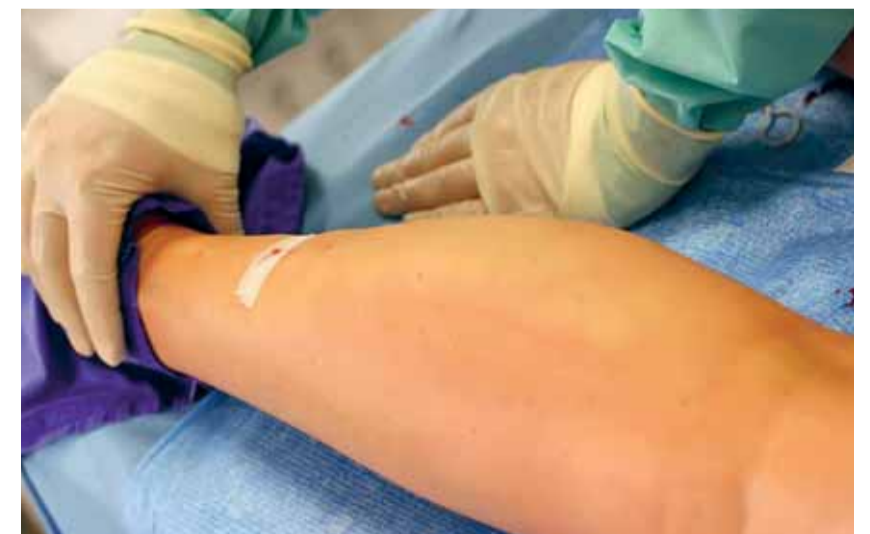
Nach der Behandlung: Der Schleusen Zugang wurde mittels Klammerpflaster verschlossen, im Bereich der behandelten Vene führt die Tumescenzanästhesie zu einem temporären Ödem.

gen konnte, findet sich in RFO behandelten Patienten eine niedrigere Inzidenz für Neovaskularisation. Dies wurde bereits zuvor von Pigot und Kollegen berichtet. Sie untersuchten 63 Extremitäten und fanden kein Anzeichen für Neovaskularisation zwei Jahre nach Radiofrequenzbehandlung. Zwei große Vorteile der RFO