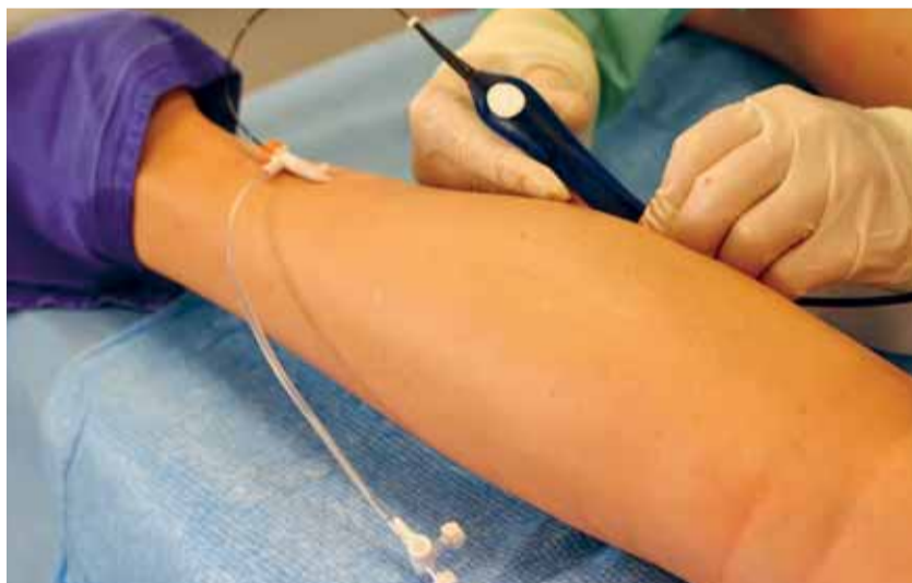
Komplette Stammvarikose der Vena saphena parva rechts: Schleuse und Katheter

scheinen für die niedrigere Inzidenz der Neovaskularisation verantwortlich zu sein. Zum einen die fehlende Inzision und chirurgische Dissektion der Leiste wie aber auch die fehlende oder minimale hämodynamische Störung des physiologischen Blutabflusses der abdominalen Wand. Zusammenfassend stellt die segmentale, endovenöse RFO eine effektive und nebenwirkungsarme Alternative zu traditionellen chirurgischen Therapien bei Patienten mit oberflächlichem venösem Rückstrom dar. Zahlreiche Studien konnten ihre Überlegenheit in Bezug auf postoperative Schmerzen, ästhetisches Ergebnis und Rekonvaleszenzzeiten zeigen. Diese Ergebnisse führten dazu, dass die segmentale endovenöse Radiowellentherapie in den Vereinigten