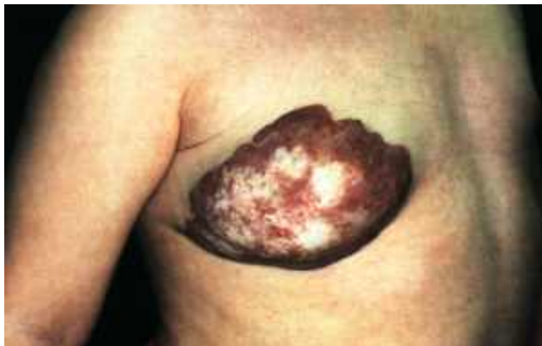
Abb.5: 2jähriges Mädchen mit großem kavernösem Hämangiom der rechten Brust;