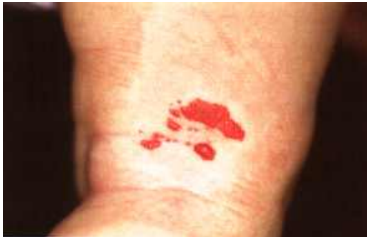
Abb. 1: Kapilläres Hämangiom am Oberschenkel

Im Zeitraum von 8 Monaten (Juli 94 bis Februar 95) wurden 43 kleine Patienten im Alter von 2 Wochen bis 7 Jahren wegen Hämangiomen mit dem gepulsten Farbstofflaser behandelt. Dabei wurden 41 Kinder im ersten Lebensjahr vorgestellt, nur 2 Patienten waren 5 bzw. 7 Jahre alt. 5 Kinder wiesen 2 Hämangiome gleichzeitig auf, so daß insgesamt über 48 Hämangiome berichtet werden kann. Alle Fälle wurden sorgfältig fotodokumentiert, um den Verlauf beurteilen zu können. Die Läsionen wurden teilweise in den ersten Lebenstagen bemerkt, andere entwickelten sich erst nach einigen Wochen. Sehr unterschiedlich waren horizontale Ausdehnung und Höhe der Hämangiome: sie reichten von 0,5 cm 2 -20 cm 2 und von 1 mm bis zu 2,5 cm Höhe. Wir unterteilten die Hämangiome je nach Ausdehnung und Dauer des Bestehens in 3 Gruppen: In Gruppe 1 befanden sich 14 Hämangiome, die innerhalb von 2 Wochen nach Auftreten behandelt werden konnten. Es handelte sich dabei um kapilläre, flache (1-2 mm hohe) und kleine Läsionen (0,5-2 cm 2 ). In Gruppe 2 waren 16 relativ kleine (bis 3 cm 2 ), kapilläre, relativ flache (bis 4 mm hohe) Hämangiome, die schon mehrere Wochen gewachsen waren (Abb.1).