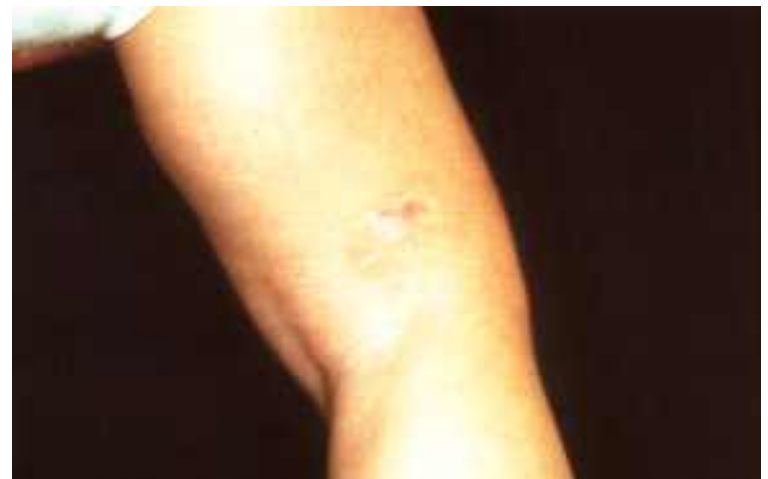
Abb. 2: Zustand nach 5 Sitzungen mit dem Farbstofflaser

Gruppe 3 umfaßte 18 Hämangiome mit einer Ausdehnung von über 3cm 2 , einer Höhe von über 4mm und/oder einem tiefen kavernösen Anteil (Abb. 3). 2 dieser Hämangiome hatten sich initial in der Tiefe entwickelt ohne oberflächlichen Anteil. 2 weitere Hämangiome wiesen farbduplex-sonographisch erfaßte Shuntbildungen zu tiefer liegenden Gefäßen auf (Abb. 5). 5 Hämangiome dieser Gruppe befanden sich an Ober- oder Unterlippe mit Übergang zur Mundschleimhaut.