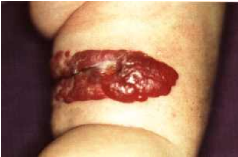
Abb.3: Großes, zentral ulzeriertes Hämangiom am Oberschenkel