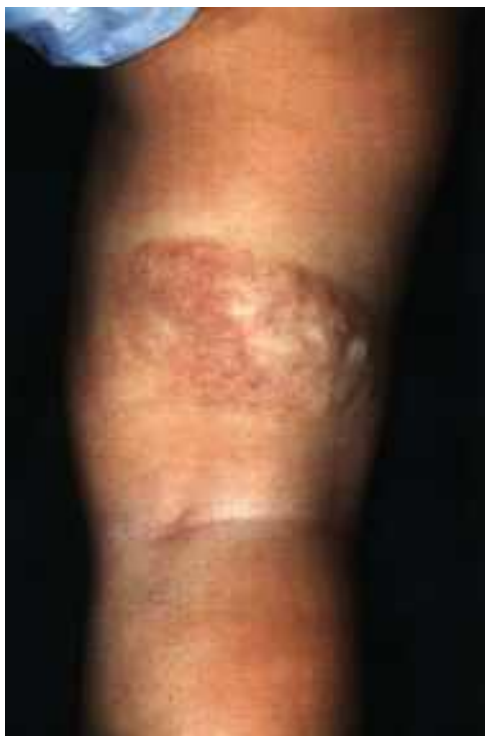
Abb.4: Abheilung unter Hinterlassen eines narbig-atrophischen Areals nach 12 Laserbehandlungen innerhalb eines Jahres