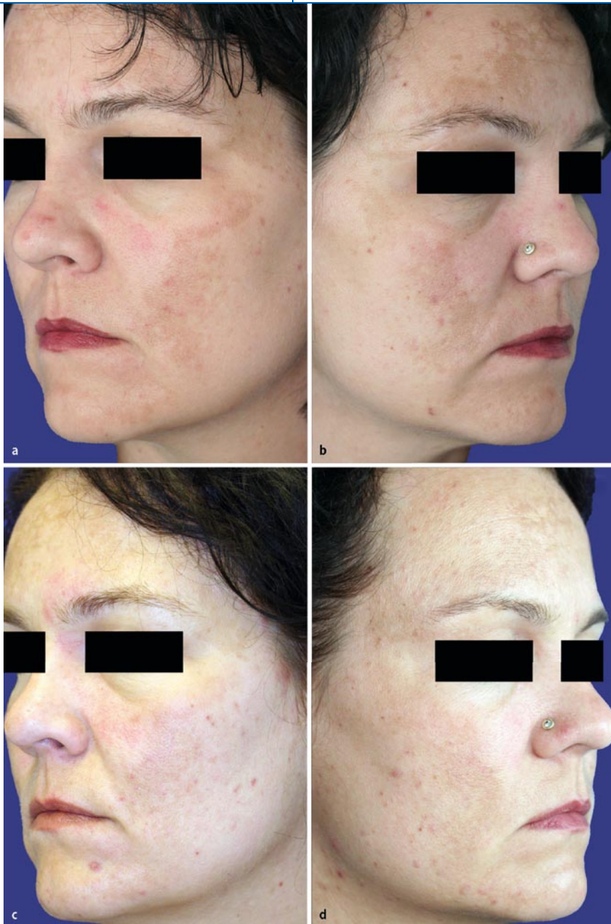
Abb. 1 ▲ a, b Melasma im Stirn- und Wangenbereich. c, d Zustand 3 Monate nach 6 Sitzungen mit dem Affirm® (Behandlungsparameter s. Text)

lung zahlreicher kutaner Manifestationen etabliert [2]. In der Behandlung des Melasma hat sich die selektive Photothermolyse jedoch nicht durchsetzen können [14]. Die Ergebnisse sind sowohl für den gütegeschalteten Rubin-, den frequenzverdoppelten (532-nm-)Nd-YAG-Laser und den 510-nm-Farbstofflaser überwiegend enttäuschend (z. B. [23, 30, 51, 54]); zudem besteht das Risiko von lang anhaltenden oder sogar persistierenden Hyperpigmentierungen [28, 54]. Einige klinische Studien berichten auch über Erfolge nach einer kombinierten