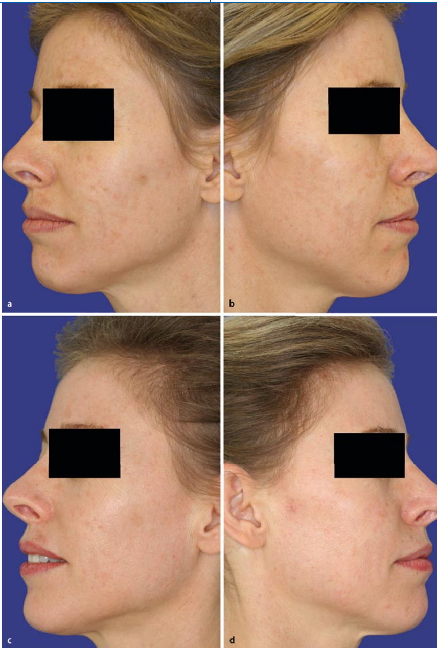
Abb. 3 ▲ a, b Melasma im Stirn- und Wangenbereich. c, d Zustand 3 Monate nach 4 Sitzungen mit dem Affirm® (Behandlungsparameter s. Text)

on der melanintragenden Makrophagen liegen [11, 15, 33].